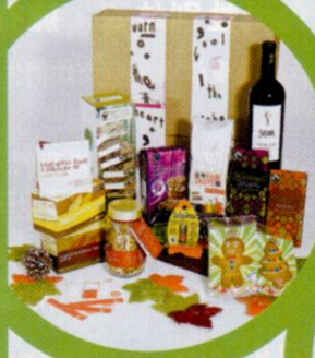
FAIR TRADE x WWF Christmas Gift Set $699

Gift Set內有多款 WWF的精品及公平 貿易產品，包括朱古 力、橄欖油、茶葉及 糖果糖等。