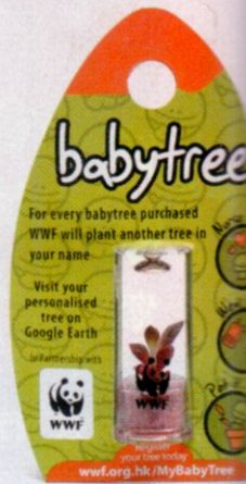
My Baby Tree