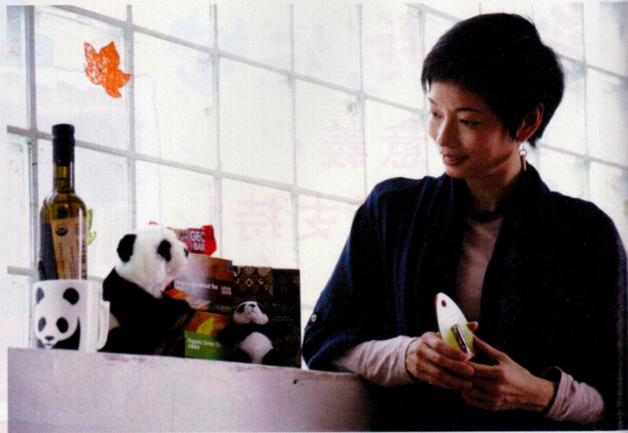
FAIR TRADE x WWF Christmas Gift Set 1,699